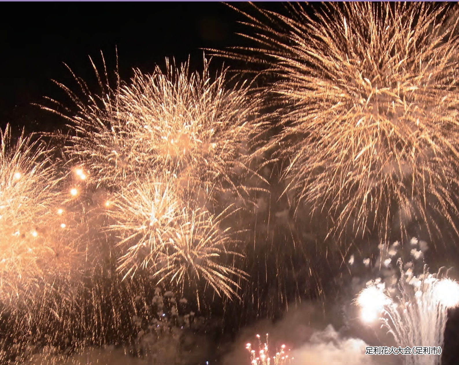
足利花火大会(足利市)