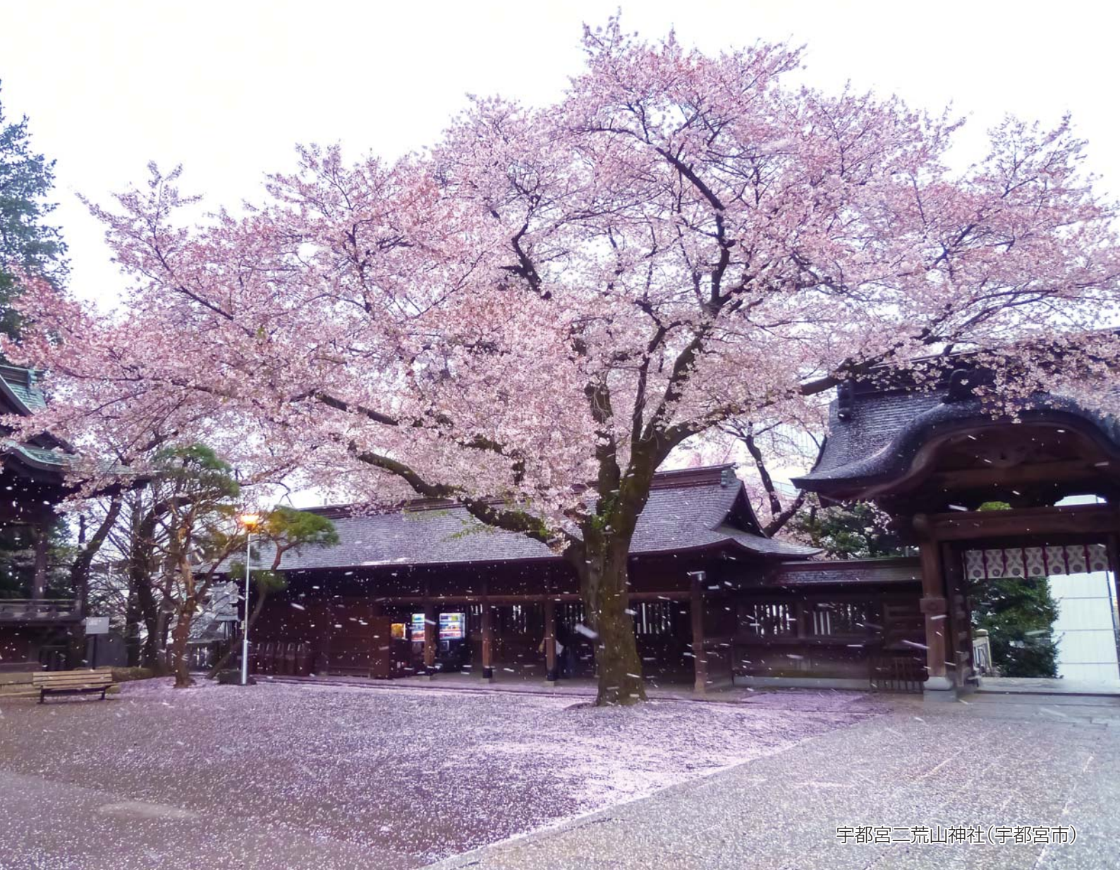
宇都宮二荒山神社(宇都宮市)