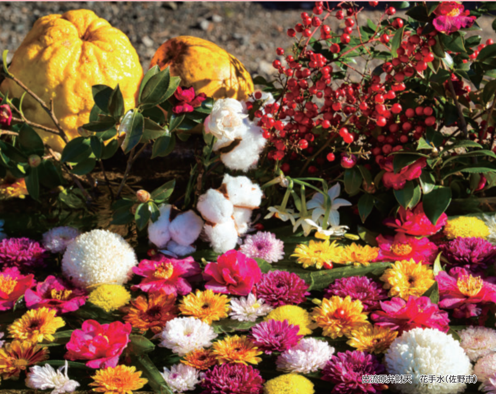
出流原券財天 花手水(佐野市)